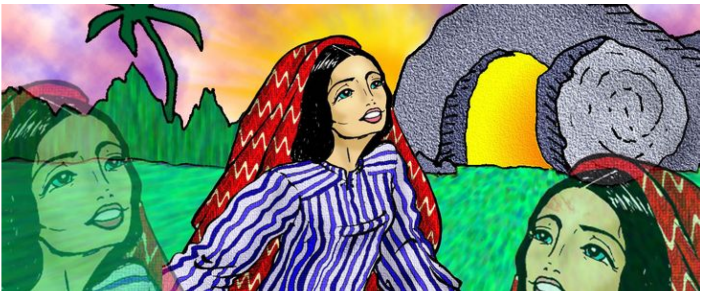
El sepulcro vacío

Domingo de Resurrección - 5 de abril de 2026