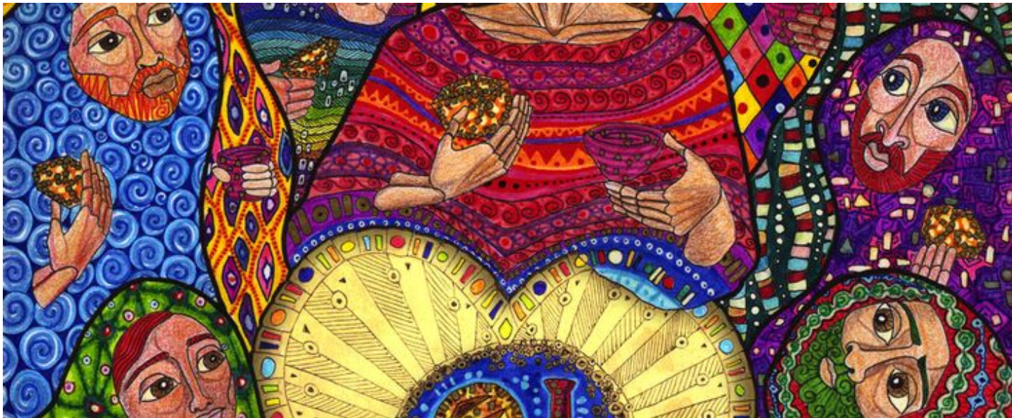
El lavatorio de los pies