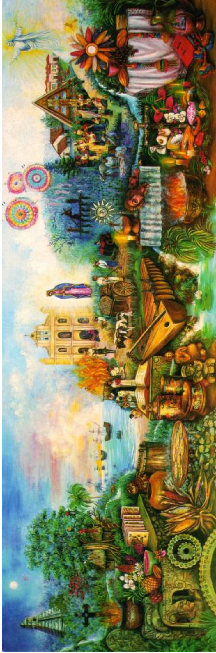
El ayer, el hoy y el mañana de la evangelización cristiana de los q'eqchis (Verapaz) Mural al óleo sobre tela de 2 x 6 m., por Rosa María Pascual de Gámez Centro Ak'kutan, Cobán, Alta Verapaz, Guatemala, 1995